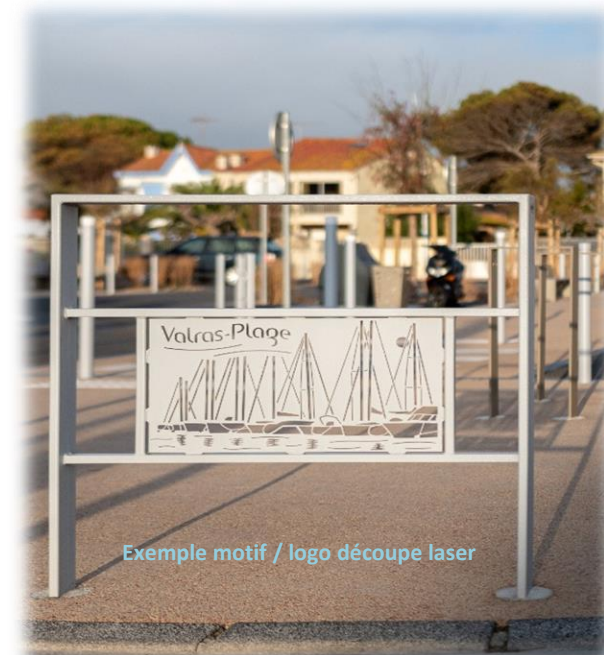
Exemple motif / logo découpe laser