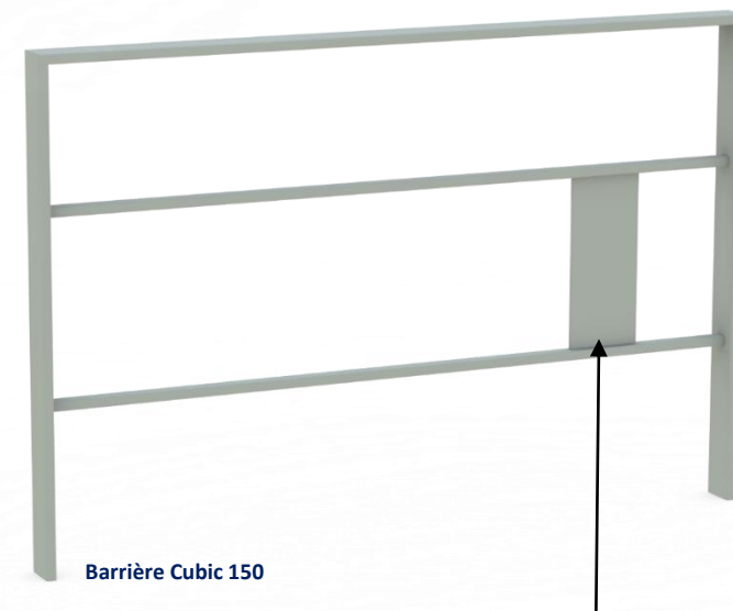
Barrière Cubic 150