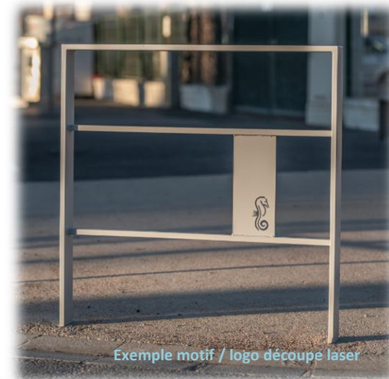
Exemple motif / logo découpe laser