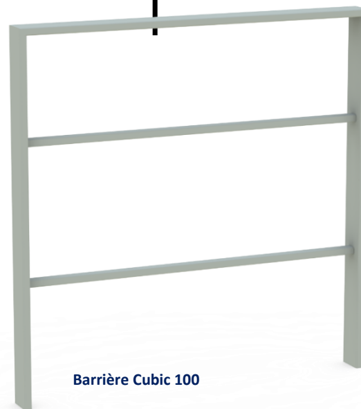
Barrière Cubic 100