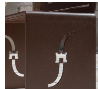
Option découpe laser

Scellement par 4 tiges Ø12mm (non fournies)