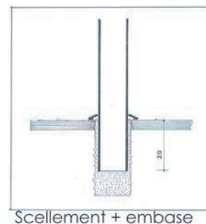
Scellement + embase